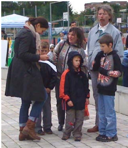
START Blitzbefragung Stadtteilstift Juli 2011