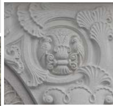
Würzburger Straße 40