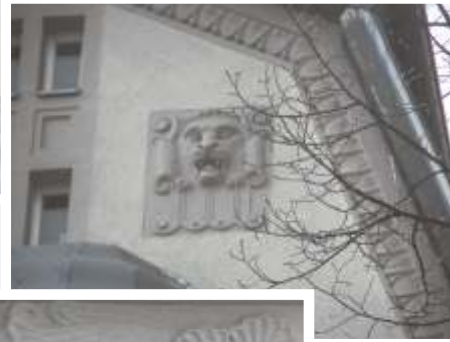
Würzburger Straße 37