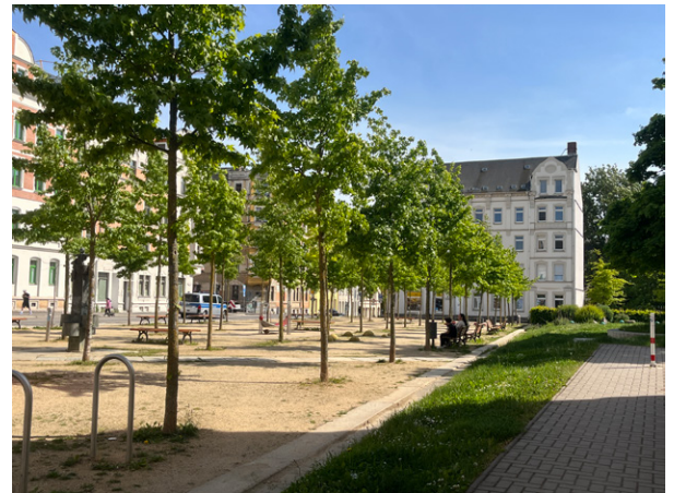
Abb. 5: Rüdiger-Alberti-Park, eigene Aufnahme.

Abb. 4: Rüdiger-Alberti-Park, eigene Aufnahme.