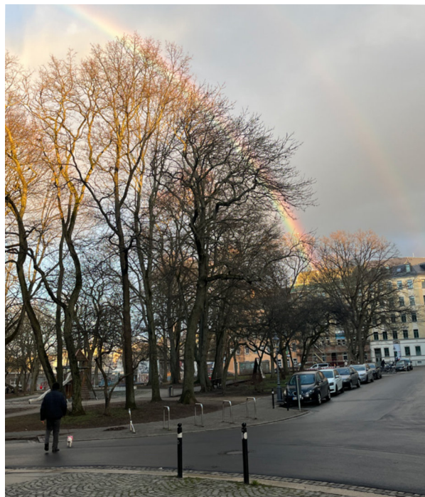
Abb. 46: Wohnungen in Plattenbauweise, eigene Darstellung.

Damit der Sonnenberg zum zukunftsfähigen ‚Sorgenden Stadtteil‘ werden kann, darf Sorge nicht länger als vornehmlich private Aufgabe missverstanden werden oder als informelle Kompensation für unzureichende formelle (staatliche) Absicherung und Daseinsvorsorge fungieren. Die notwendige Transformation von einer reaktiven sozialen Kompensation hin zu einer resilienten ‚Sorgenden Stadt‘ erfordert eine Abkehr von temporären Projektlogiken hin zu einer verstetigten Sorge-Governance. Sofern Verwaltung und Planung eine strategische Zielsetzung der Sorge verfolgen, diversen Perspektiven auf Sorge und die Bedarfe aller Nutzenden konsequent in den Mittelpunkt rücken, die lokalen Akteur*innen und Netzwerke umfassend einbeziehen und strukturell sowie finanziell absichern, kann der Sonnenberg als urbanes Reallabor der Sorge fungieren. Denn eine gemeinwohlorientierte, sozial gerechte und inklusive Quartiersentwicklung entfaltet dann ihre Wirksamkeit, wenn Sorge als Kernaufgabe der Daseinsvorsorge begriffen wird. Durch diese strukturelle Anerkennung kann das emanzipatorische Potenzial des Sonnenbergs langfristig gesichert und ein ‚gutes Leben für alle‘ im Stadtteil, das über individuelle Privilegien hinausreicht, ermöglicht werden.